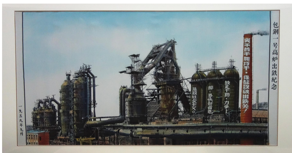
包钢一号高炉出铁纪念品

间艺术等行业协会和知名创作者创作的优秀艺术作品等；包头籍或在包头市工作活动过的非包头籍知名人士的自传、回忆录、论著手稿、重要活动照片、音视频及各类证书等；市直各机关团体、企事业单位、各行各业荣获全国、自治区级荣誉称号和市委、市政府表彰奖励的证书、奖状、奖杯、牌匾等。